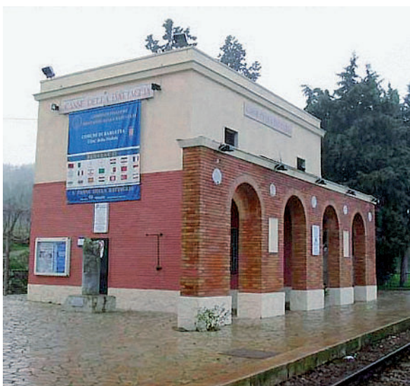
Canne della Battaglia Sopra la stazioncina; in alto il muro

tifica e della gestione, lasciando al Comune la parte della manutenzione.